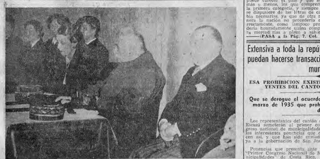
La hija del glorioso mariscal Mannerheim, el héroe de la defensa de Finlandia en la actual guerra contra la invasión soviética, el vencedor de los rusos hace veinte años, dicta una conferencia en París en un acto de homenaje a su patria; cerca de ella se ve al glorioso mariscal francés Franchet D'Esperey, vencedor en la guerra de los Balcanes durante la pasada contienda mundial, una de las glorias militares más legítimas de Francia